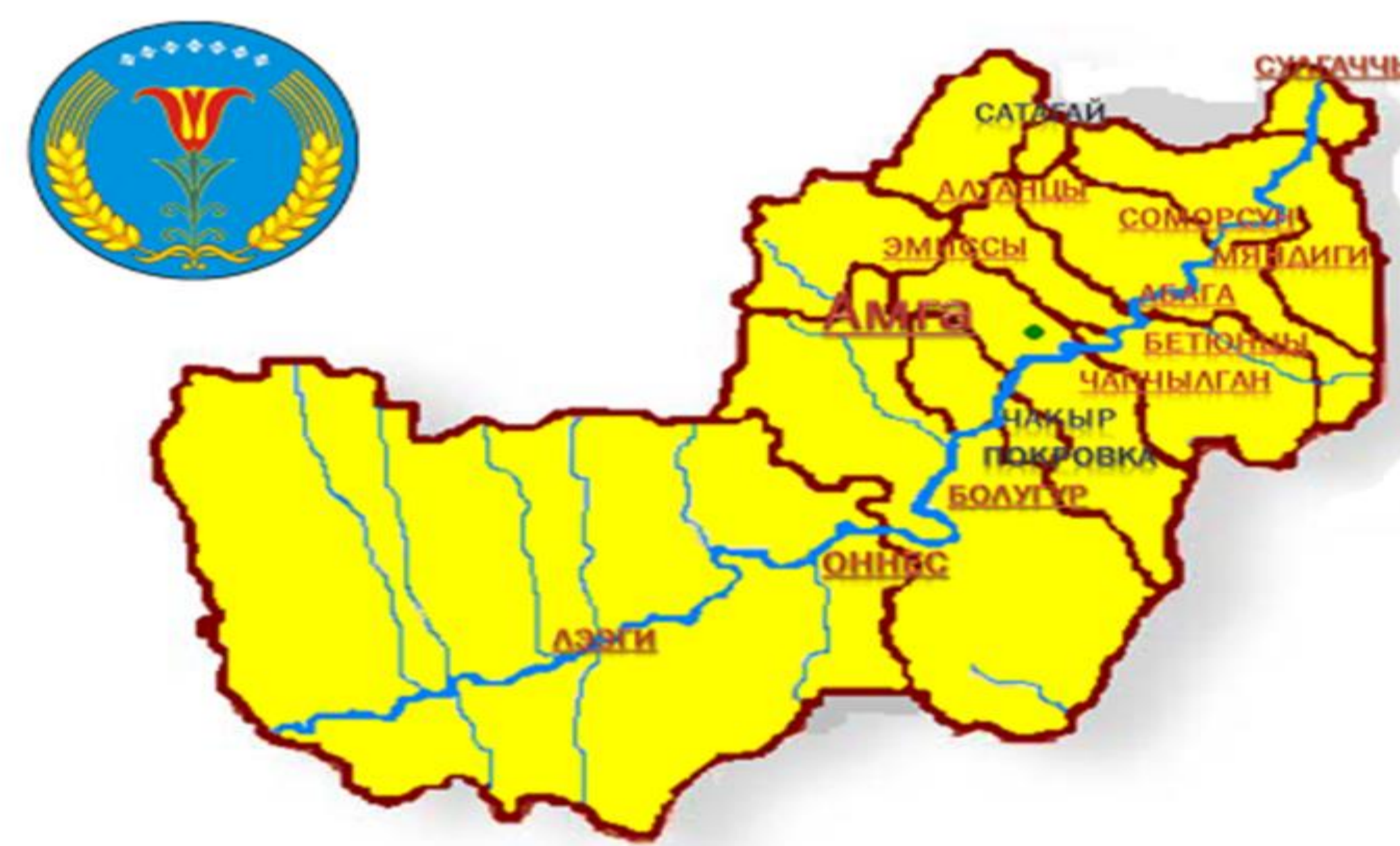
Рис. 3. Электронная карта «Литературная Амга».