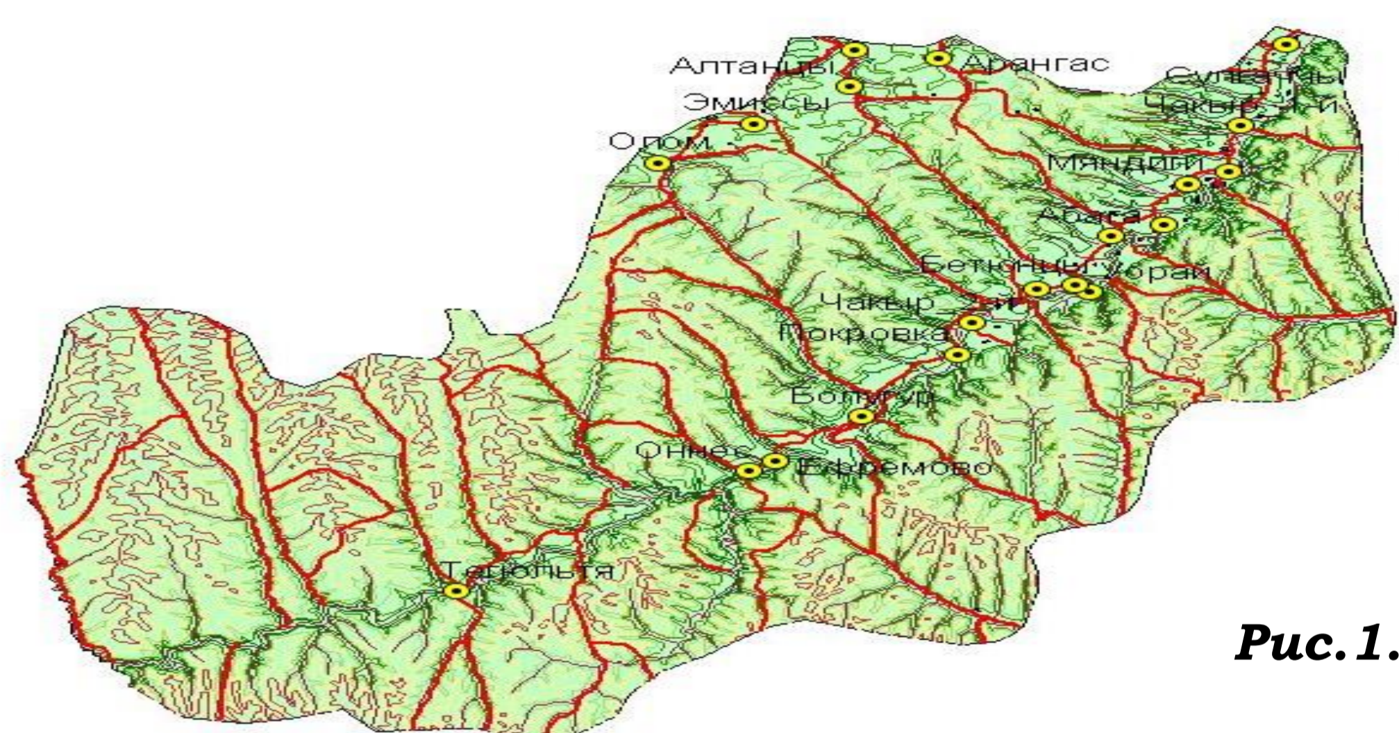
Рис. 1. Карта Амгинского улуса