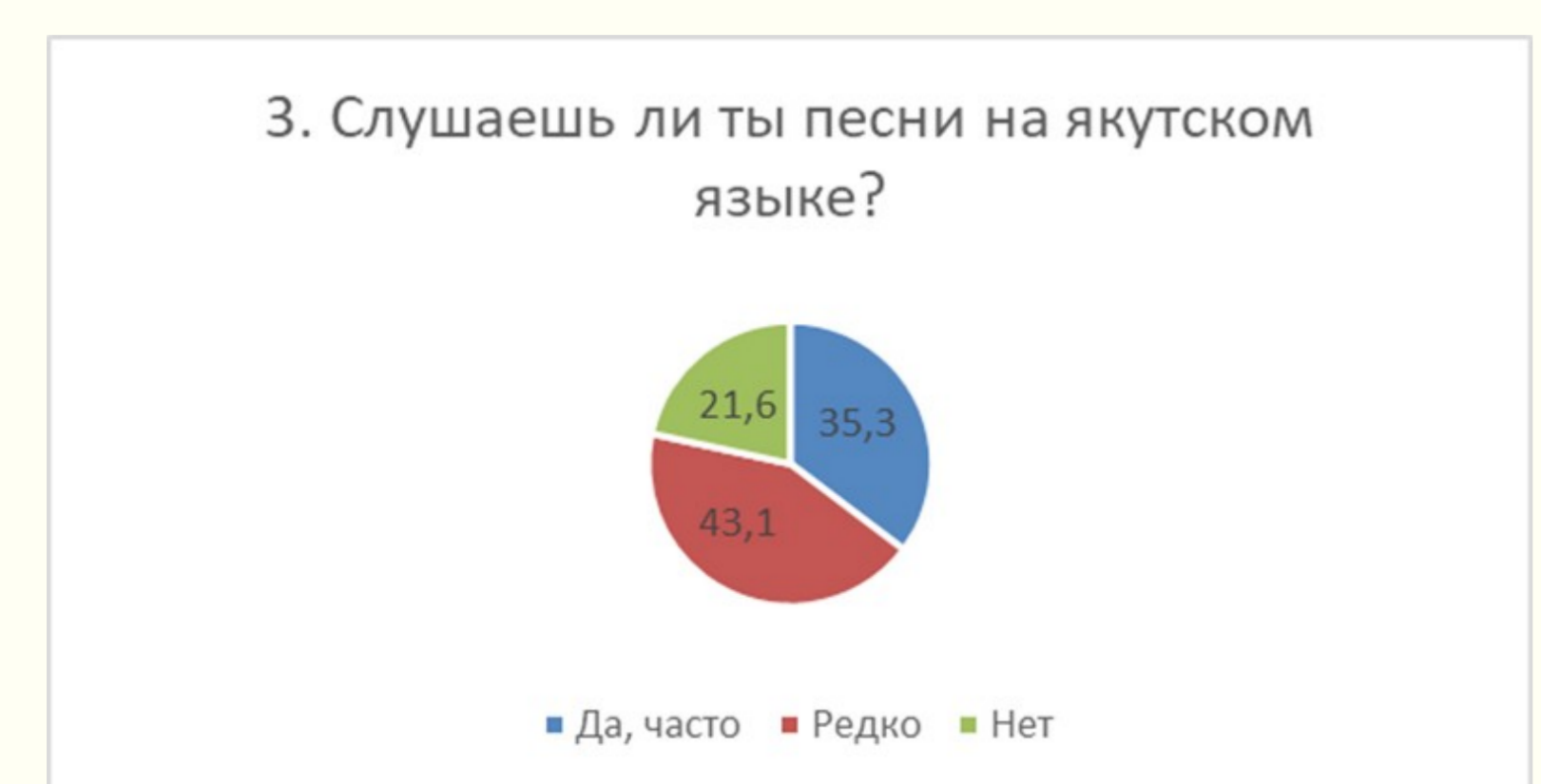
Диаграмма показывает, что 36% слушают песни на якутском языке, 43% слушают иногда и лишь 21% не слушают. Как мы видим, большинство респондентов (79%) слушают музыку на якутском языке.

Актуальность работы заключается в рассмотрении методики использования песен на уроке якутского языка как источника дополнительного стимула для изучения языка и реализации целей образовательной программы.