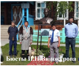
Бюсты И.Н.Винокурова в Чураччинском районе