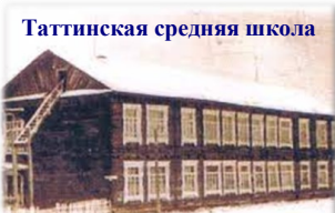
Таттинская средняя школа

Закон Республики Саха (Якутия) от 25.10.2003 г. УТВЕРЖАЮ Эдуард Профимов Губернатор Республики Саха (Якутия)