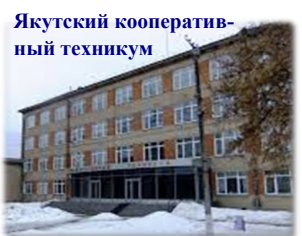
Якутский кооперативный техникум