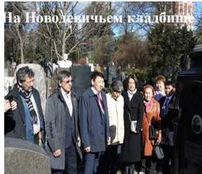
На Новолентичьев кладбище