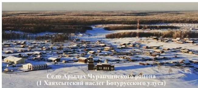
Село Арылах Чураччинского района (1 Хяхсытский наслед Ботурусского улуса)