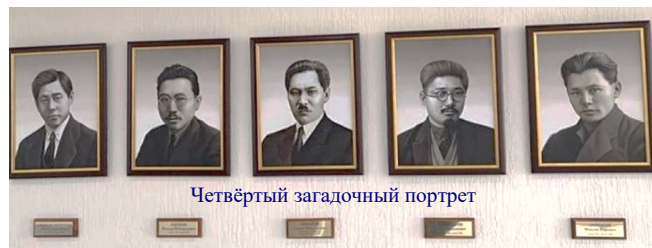
Четвёртый загадочный портрет