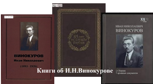
Книги об И.Н.Винокурове