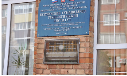
Мемориальная доска на стене первого корпуса Бузулукского гуманитарно-технологического института (филиала) ОренбургскогоГУ.