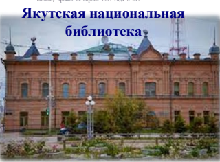
Якутская национальная библиотека